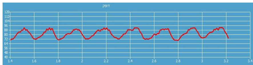
בתמונה: "לב בשר" - שינויים גדולים ומסודרים בדופק

Inter-individual Differences in Heart Rate Variability Are Associated with Inter- 3 individual Differences in Empathy and Alexithymia Front Psychol. 2018; 9: 229